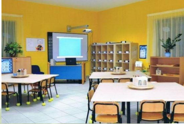
“Scuola senza zaino”